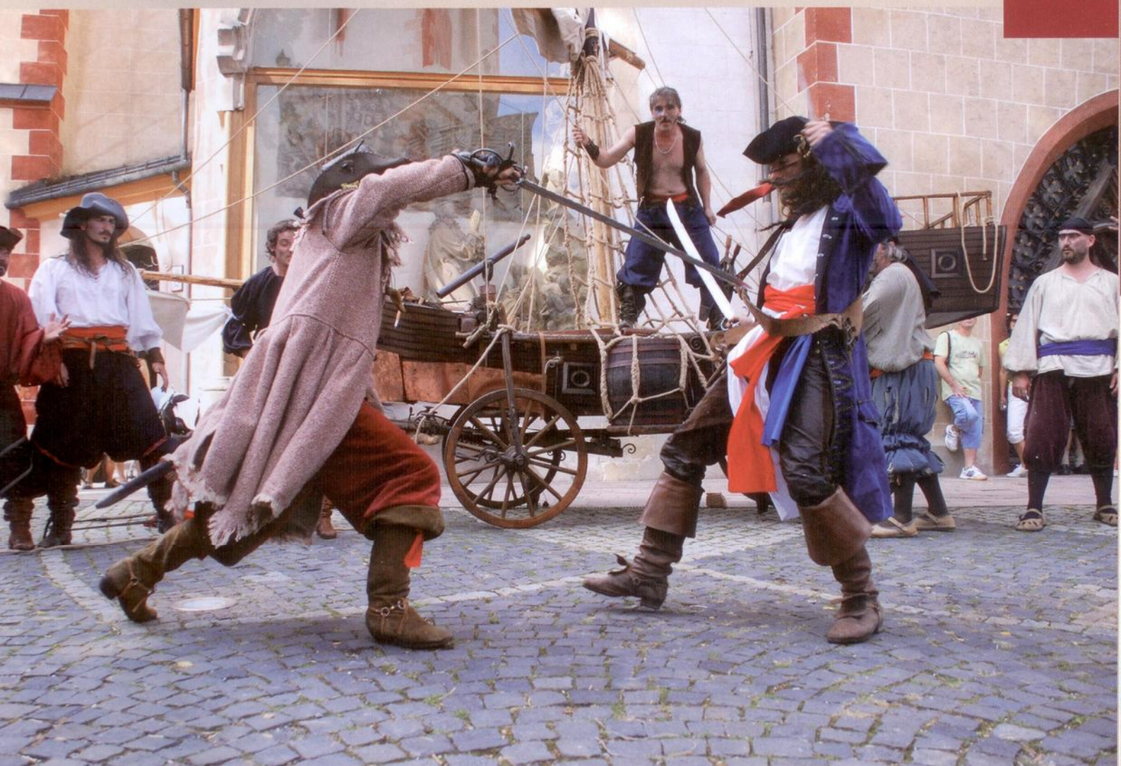
ČASSANOVA - SPOLOČNOSŤ VESELÝCH ŠERMIAROV Z BANSKEJ BYSTRICE

UVEDENÉ V ŇOM VYVOLALO CHUŤ VIDIEŤ NIEČO PODOBNÉ OPÄŤ, NAVŠTÍVIŤ NIEKTORÝ Z HRADOV, TÝČIACICH SA NAD NAŠIMI HLAVAMI, MÚZEUM, POZRIEŤ SI HISTORICKÝ FILM. ALEBO SI RADŠEJ PRI POČUTÍ SLOV HISTORICKÝ ŠERM ZÁJSŤ DO STÁNKU PO KLOBÁSU, ALEBO SI DAŤ V BARE DRINK. VÄČŠINOU VŠAK HISTORICKÝ ŠERM VO VÁS VYVOLÁ ZÁUJEM O PREDVÁDZANÝ KÚSOK Z HISTÓRIE LUDSTVA, ČI UŽ IDE O RIMANOV, SLOVANOV, KRÍŽIAKOV, ČI MUŠKETIEROV.